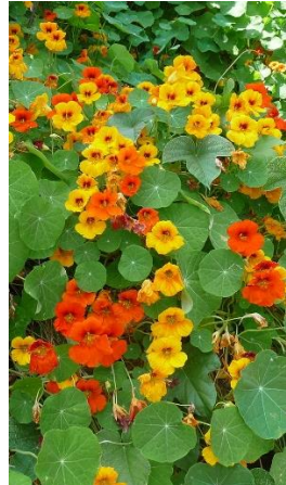
O. I. kers